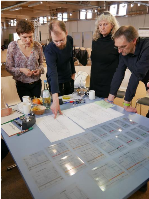
Abbildung 4: Entwicklung von Varianten der Haltestellenbereiche bei der Ideenwerkstatt