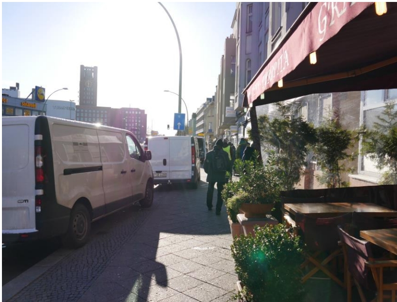
Abbildung 6: Durch haltende Lieferfahrzeuge und Außengastronomie eingeengter Gehweg