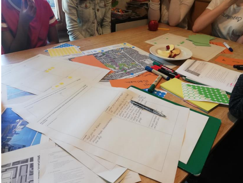
Abbildung 3: Ideensammlung mit Kindern und Jugendlichen

Am 04.04.2019 wurden anhand interaktiver Arbeit an einer Karte des Tempelhofer Damms sowie der Umgebung die Probleme, Gefahrenpunkte und Bedürfnisse von fünf Kindern und Jugendlichen im Alter zwischen 10 bis 15 Jahren erfasst und Wünsche der jungen Zielgruppe zusammengetragen.