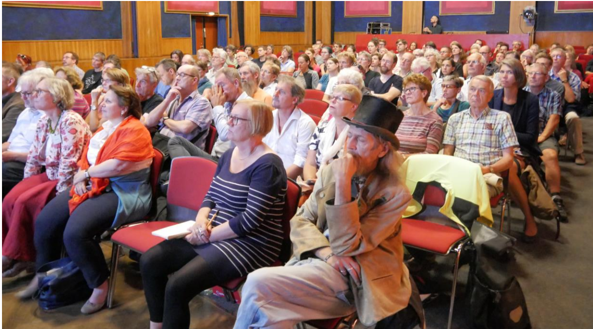
Abbildung 5: Zahlreiche Interessierte kamen zur Informationsveranstaltung am 16.08.2019 in die ufa-Fabrik