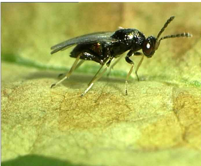
Erzwespe ( Pnigalio agraulis )

In Berlin konnten bisher im Stadtgebiet nahezu 20 parasitische Wespenarten nachgewiesen werden. Die Ursachen für die geringe Effektivität der natürlichen Gegenspieler wird derzeit untersucht und es werden Möglichkeiten zur effizienteren Nutzung der Nützlinge geprüft.