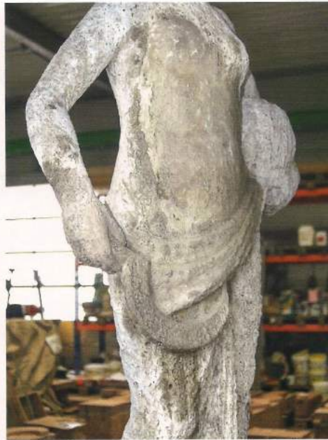
...und in der Werkstatt.