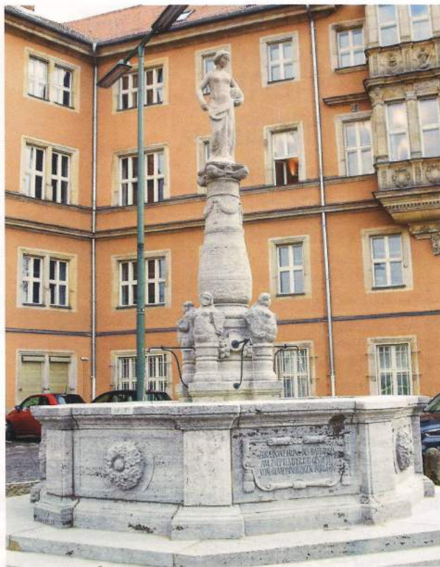
Nach der Restaurierung präsentieren sich die Schnitterin und ihr Gefolge fast wie neu.

Eine feierliche Platz-Namensgebung wurde es, der Anwohner und hochkarätige Weggefährten von Hanna-Renate Laurien, der „Frau der klaren Worte“, genau einen Tag vor ihrem 88. Geburtstag folgten. Unter den Gästen auch der ehemalige regierende Bürgermeister von Berlin Eberhard Diepgen, der letzte DDR-Bildungsminister Hans Joachim Meyer, der Präsident des Europäischen Parlaments a.D. und Vorsitzende der Konrad-Adenauer-