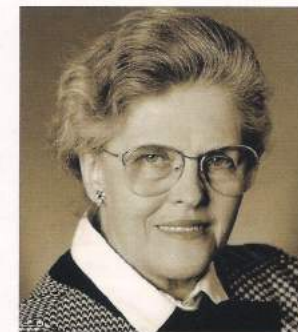
Bildungspolitikerin Hanna-Renate Laurien.

Im September vorigen Jahres hatte dort die allegorische