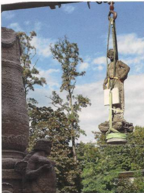
Die Schnitterin auf dem Weg zur Restauration...