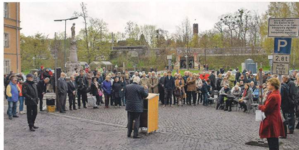
Feierliche Namensgebung im April.

3 x in Berlin: Flughafen Tempelhof · Mariendorf · KuDamm Jetzt Tanzen entdecken! kostenlose Schnupperstunde