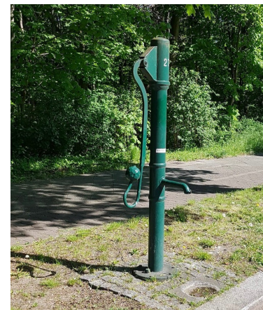
Аварийные источники питьевой воды