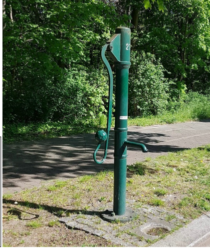
آبار المياه في حالات الطوارئ