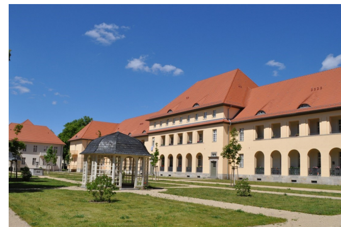
Ludwig-Hoffmann-Quartier in Buch