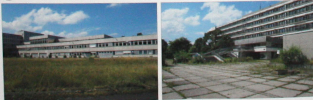
Konzepte zur baulichen Nachnutzung oder Renaturierung von Flächen mit Funktionsverlust