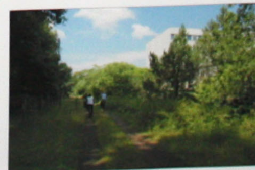
Ggf. Anbindung und Erschließung der ehem. Regierungskrankenhäuser

Kein Wohnen an der Moorlinse! → Alternative: Ehem. Regierungskrankenhäuser