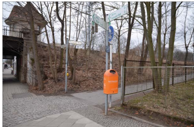
Verlegung des Pankeradwegs über den beleuchteten Röntgentaler Weg