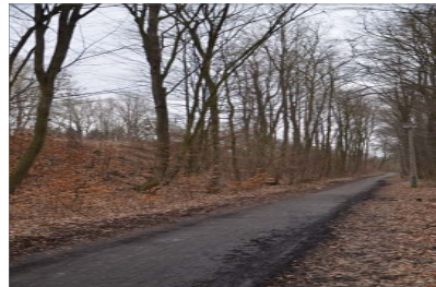
Befestigung des Weges im Bereich des Schlossparks