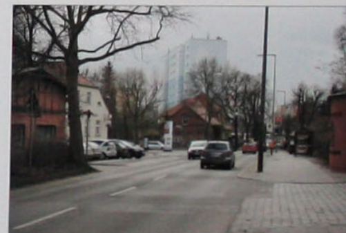
Qualifizierung des Straßenraums Alt-Buch Konzept zur Stärkung und Verknüpfung der neuen Bucher Mitte und Alt-Buch Schaffung von Aufenthaltsbereichen als Begegnungsräume

Entrée gegenüber dem neuen Zentrum Schlosspark