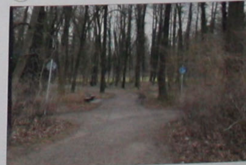
Qualifizierung wichtiger Eingänge in den Park