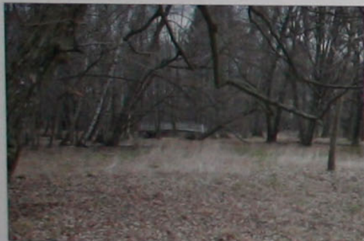
Verfahren zum Naturschutzgebiet Schlosspark Erstellung des Parkpflegewerks und der denkmalgerechten Erneuerung ist abhängig von der Entscheidung zum Verfahren