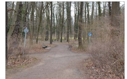
Qualifizierung wichtiger Eingänge in den Park