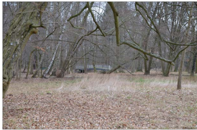
Verfahren zum Naturschutzgebiet Schlosspark Erstellung des Parkpflegewerks und der denkmalgerechten Erneuerung ist abhängig von der Entscheidung zum Verfahren