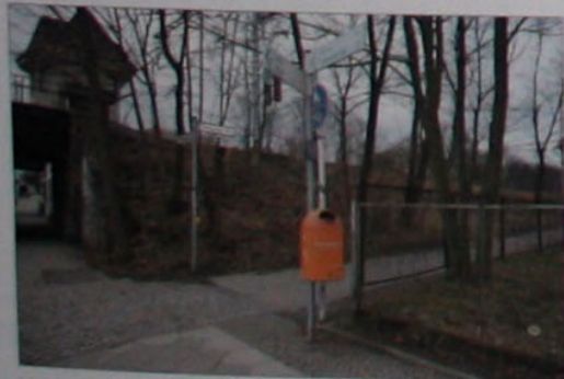
Verlegung des Pankeradwegs über den beleuchteten Röntgentaler Weg