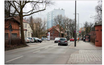
Qualifizierung des Straßenraums Alt-Buch Konzept zur Stärkung und Verknüpfung der neuen Bucher Mitte und Alt-Buch Schaffung von Aufenthaltsbereichen als Begegnungsräume