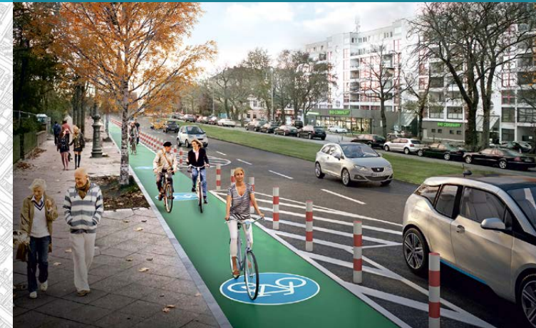
Visualisierung der Protected Bike Lane an der Hasenheide.

Mit der Anlage der neuen Radinfrastruktur wird zwischen Hermannplatz und Weichselstraße dann in jeder Fahrtrichtung nur noch eine Spur für den Pkw-Verkehr zur Verfügung stehen.