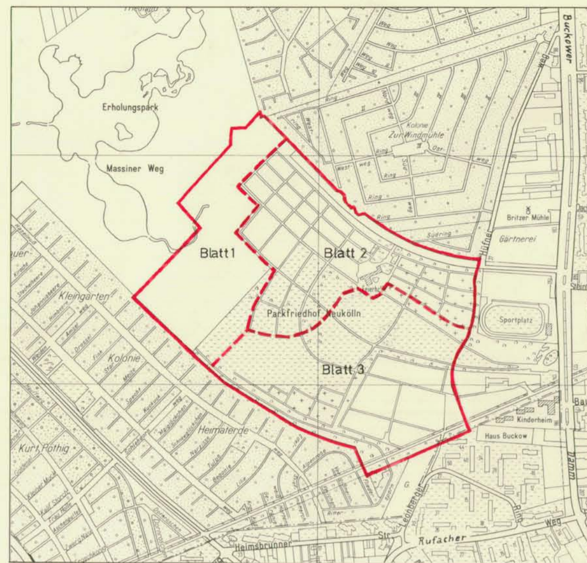
Ausschnitt aus dem Flächennutzungsplan von Berlin 1:10 000