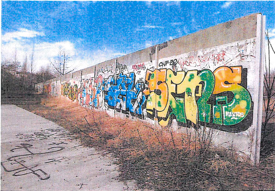
Wandfläche Nr. 2 im Park am Nordbahnhof (kleiner)