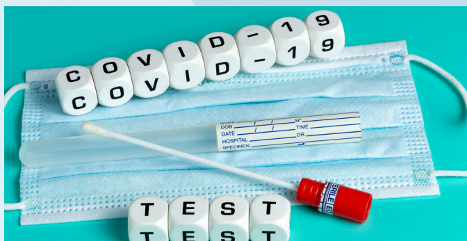
covid-19 - test sample tube