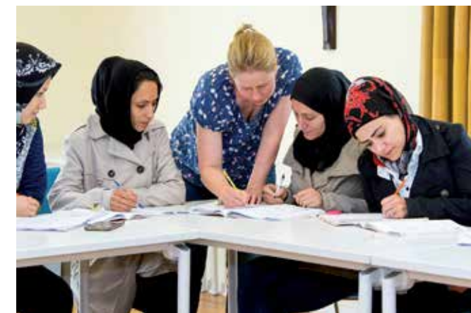
Unterricht im Deutschkurs für geflüchtete Frauen in Räumen des Katholischen Deutschen Frauenbundes

Deutsch A2.1 – Basiskurs Modul 3 intensiv nachmittags