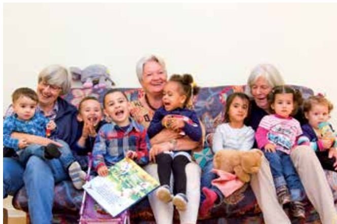
Ehrenamtliche Kinderbeaufsichtigung im KDFB