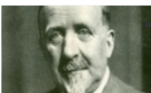
• Mann, Heinrich Schriftsteller, Präsident der Sektion Dichtkunst der Preußischen Akademie der Künste