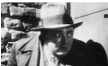
• Lorre, Peter Schauspieler