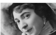
• Massary, Fritzi Operettensängerin