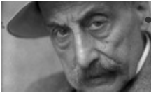
• Liebermann, Max Maler, Grafiker