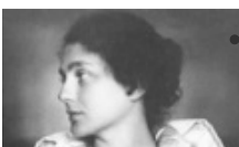
• Mannheim, Lucie Schauspielerin