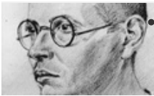
• Litten, Hans Rechtsanwalt