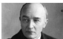
Musil, Robert Schriftsteller