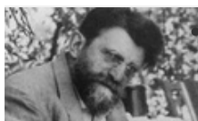
Mühsam, Erich Revolutionärer Schriftsteller