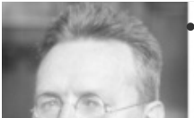
• Löbe, Paul Politiker, Präsident des Reichstags