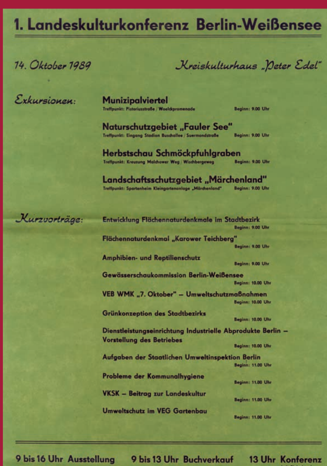
Die SED war sich der Umweltproblematik in Berlin (Ost) durchaus bewusst und versuchte über die Räte der Bezirke die Kritik durch „Landeskulturkonferenzen“ in den Berliner Stadtbezirken zu kanalisieren und über Lösungen zu beraten.

Während in Berlin (West) noch der Kampf um die Zuständigkeit im Naturschutz viele Aktivitäten lähmte, schritt man in Berlin (Ost) zu einer neuen gesetzlichen Regelung des Naturschutzes für die gesamte DDR. Das „Gesetz zur Pflege und Erhaltung der heimatischen Natur (Naturschutzgesetz) vom 4. August 1954“ löste das Reichsnaturschutzgesetz ab.