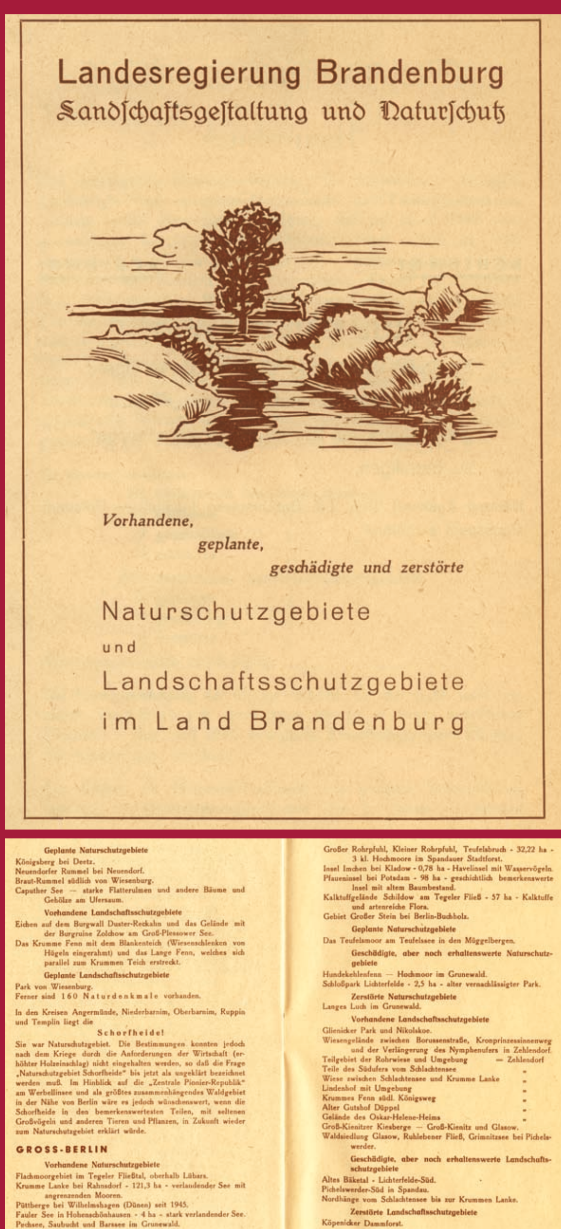
Für den Naturschutz in Brandenburg war die Auseinandersetzung mit der Natur in der Stadt in Berlin (Ost) bereits seit den 1950er Jahren selbstverständlich.