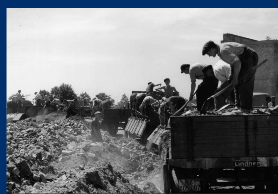
Berlin 1946: Arbeiten bei der Aufschüttung des Teufelsberges in Berlin. Nach seiner Begrünung entstand eine Erholungslandschaft für die BerlinerInnen