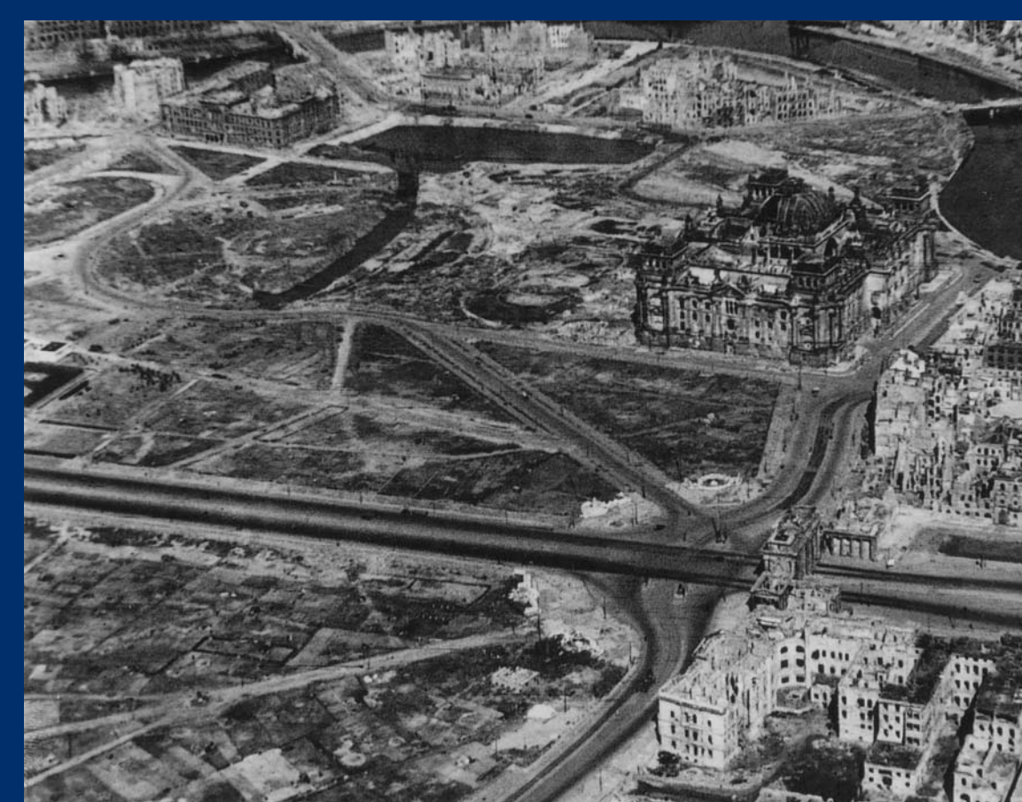
Berlin 1946: Der zerstörte Reichstag und seine Umgebung