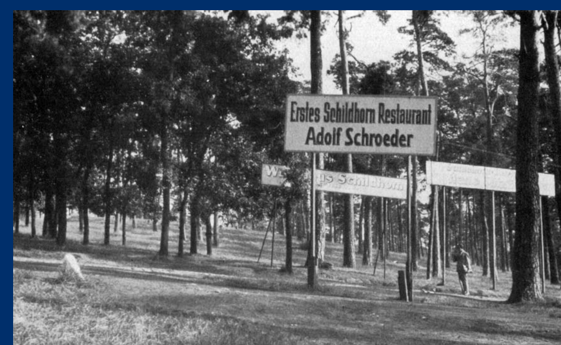
H. Helfer versuchte den Grunewald reklamefrei zu halten. Quelle: Th. Behme: Reklame und Heimatbild. Neudamm, 1931

Naturschutz ist Sache der Polizei, nicht der Gärtner