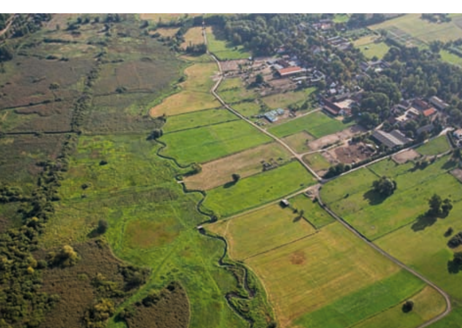
Zum Natura 2000-Gebiet Tegeler Fließtal gehören heute neben dem Landschaftsschutzgebiet Tegeler Fließ auch das Naturschutzgebiet Kalkuffelände am Tegeler Fließ und das Naturschutzgebiet Niedermoorwiesen am Tegeler Fließ