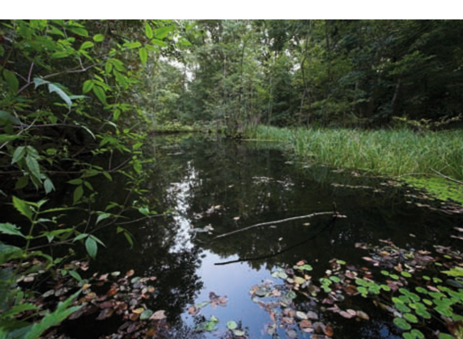
H. Helfer sorgte u. a. dafür, dass die Kleine und Große Kuhlake 1952 in das Landschaftsschutzgebiet Spandauer Forst einbezogen wurden.