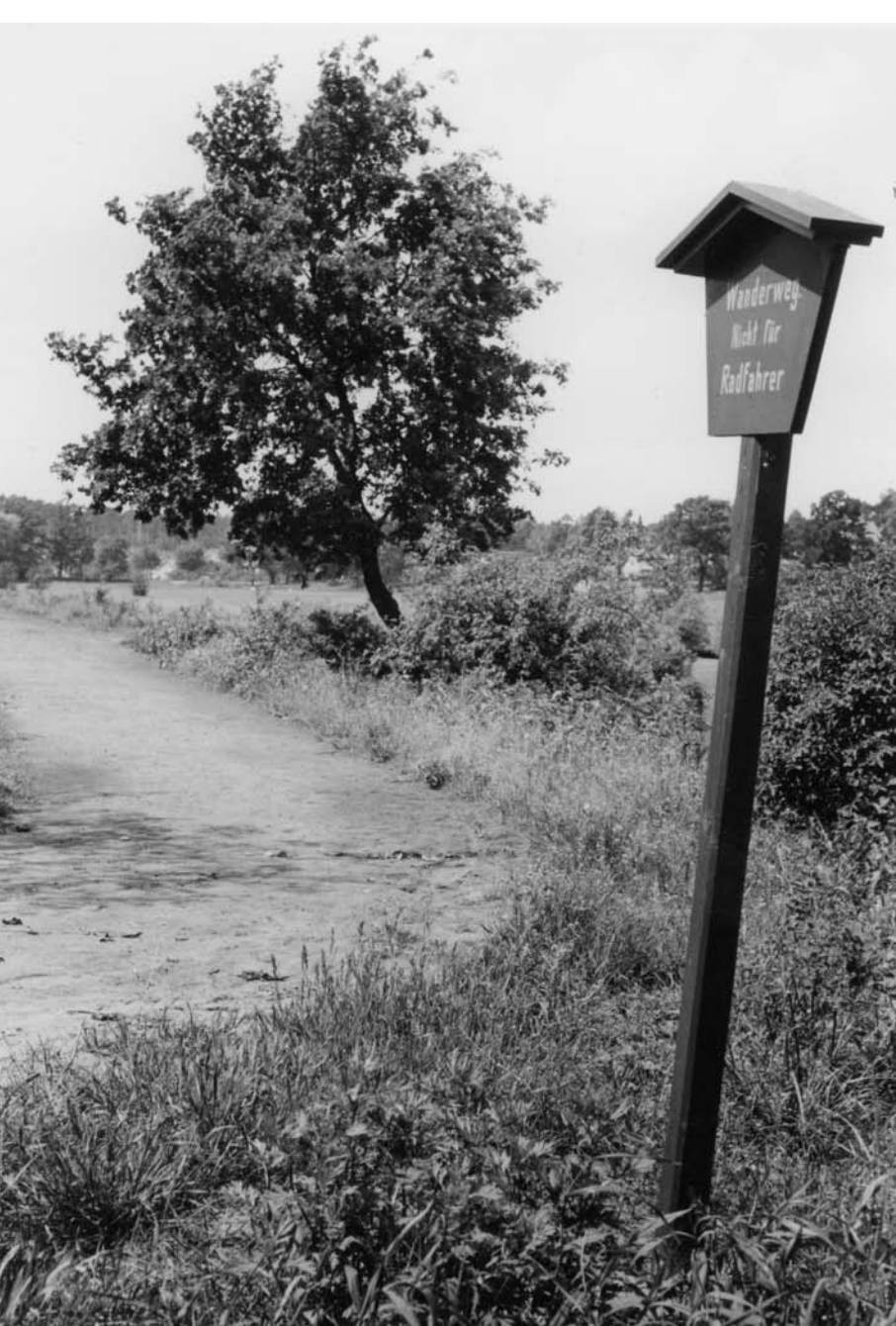
Das Tegeler Fließtal als eines der wichtigsten Schutzgebiete Berlins wurde auch von H. Helfer mehrmals vor Eingriffen geschützt.